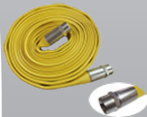
Tuyau air comprimé aplatissable Gros Ø spécial gros débit