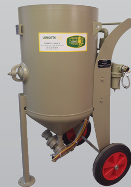
Grenailleuse CLEMCO Toute capacités Toutes configurations