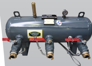
Nourrice air comprimé Pour alimenter 1 à 3 grenailleuses