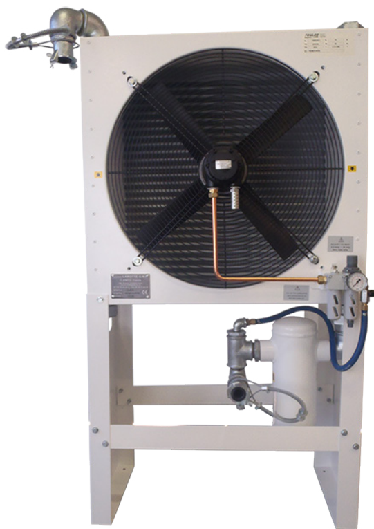
Modèle présenté : AER774