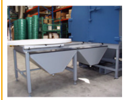
Table tournante sur rails extérieurs de chargement Charge 250 kg (En option : charge > 250 kg) Avec ou sans trémie