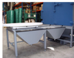
Table tournante sur rails extérieurs de chargement Charge 250 kg (En option : charge > 250 kg) Avec ou sans trémie