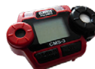
Détecteur pour monoxyde de carbone (CO)