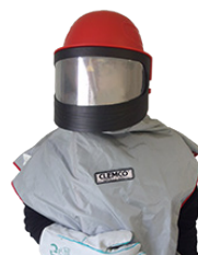
Casque de sablage CLEMCO CE