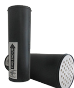
Cartouches de rechange