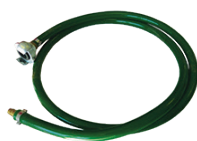
Tuyau de liaison Longueur 2 m