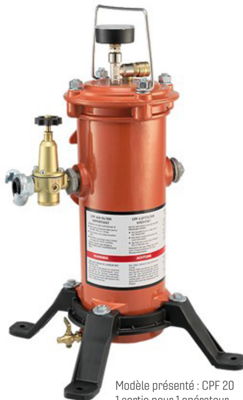
Modèle présenté : CPF 20 1 sortie pour 1 opérateur