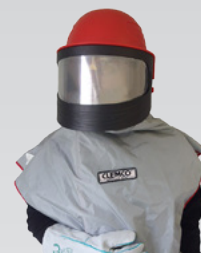
Casque de sablage Apollo 600 CE

Votre matériel de traitement de surfaces ... Le service en +!