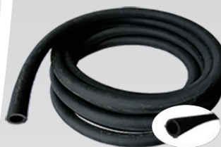
Tuyau de sablage Tous Ø