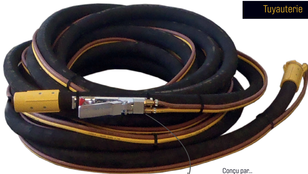
Poignée de commande à distance RLX III