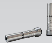
Buse Double Venturi