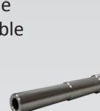
Buse Venturi longue \varnothing 16 mm