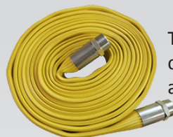
Tuyau air comprimé aplattissable