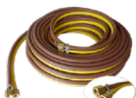
Tuyau double de commande à distance