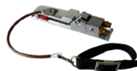
Poignée de commande à distance